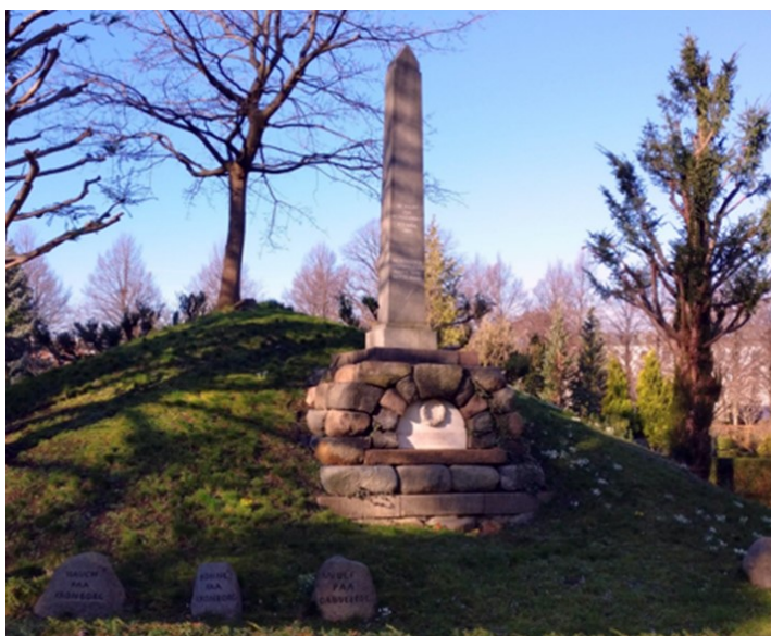
Bauta reist til minne for faldne sjøfolk ved slaget på reden i København den 2. april 1801.

Har du lyst til å stille ut noe du har laget, så ikke nøl med å ta kontakt.