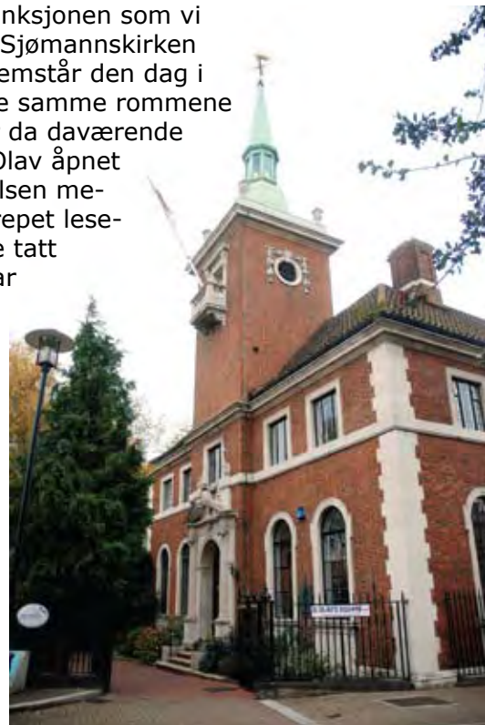
St. Olavs kirke, Sjømannskirken i London.