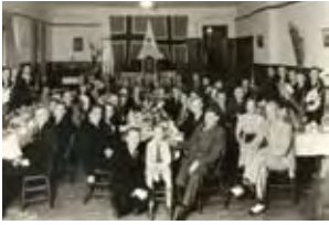
Leseværelse- begrepet s. 10