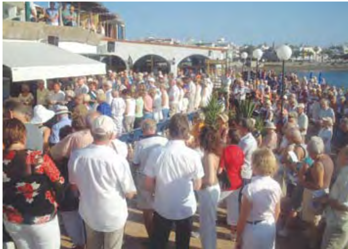
Nærmere 1000 mennesker til stede på vigslingsgudstjeneste i 2008

I disse fem år har vi kunnet glede oss over våre nye og tjenelige lokaler og flere hundre tusen mennesker har besøkt oss og adskillige tonn vafler