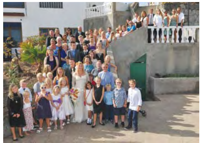
Brudeparet omkranset av alle familie, venner og alle kirkebarna.