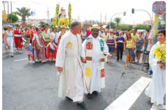
Fiestas del Carmen på kirkeplassen i Arguineguin 2012

mange konserter og kulturarrangementer, parader og fyrverkeri.