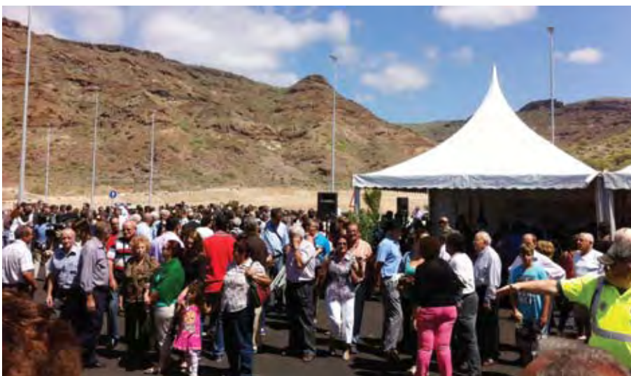
Bilde til v.: Mange mennesker var samlet til motorveiåpning mandag 25. mars kl. 11.00