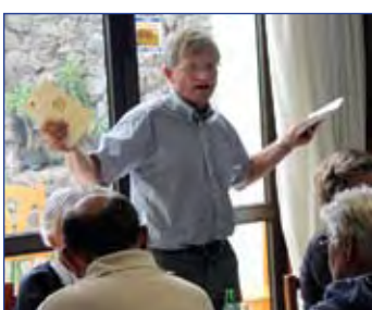
Karl takker kirkens frivillighetskorps for innsatsen i år!

Arucas! En sjarmerende liten by med majestetisk flott kirke bygd i svart lava, Arucas-stein, av lokale steinarbeidere. Tegnet i gotisk stil av den katalanske arkitekten Manuel Vega. Kirkebygget sto ferdig i 1977. Etter en høytidsstemt opplevelse i kirken, var det tid for byvandring. Gamlebyen våknet av sin siesta av en stor flokk glade nordmenn på tur. Tilslutt gikk ferden til Meson Canario med alle til bords og nydelig servering av kanariske retter. I-N