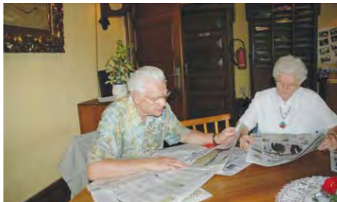
Avislesing på leseværelset på Sjømannskirken i Antwerpen. Kirken er verdens eldste sjømannskirke i fortsatt drift. Stasjonen ble opprettet i 1865.