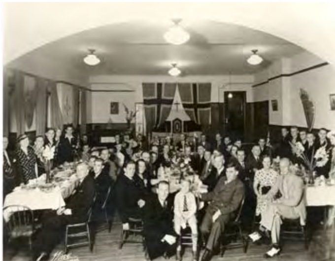
Krigsseilere samlet til fest på leseværelset på Sjømannskirken i Montreal. Sjømannskirken i Montreal ble opprettet i 1929. På grunn av nedgang i skipstrafikk og antall norske sjøfolk, ble kirken nedlagt i 1994.

Hos sjøfolk som har vært på sjømannskirker rundt om i verden har leseværelsebegrepet stor gjenklang. For turister som kommer til sjømannskirken i Arguineguin, er ikke begrepet leseværelse nødvendigvis like opplagt. Men leseværelset har for mange vært en viktig del av det å komme på en sjømannskirke. Derfor hadde vi lyst til å si litt om det.