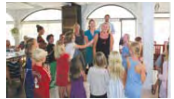
Familiefest s. 19