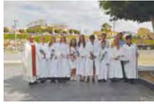
Konfirmantene s. 14