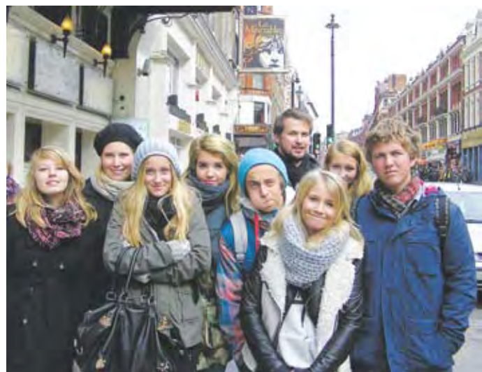
På vei til å oppleve Les Miserables i London

Konfirmantundervisningen gir, i en viktig ungdomstid, en unik mulighet til å reflektere over gudstro og viktige eksistensielle spørsmål. I tillegg til dette, er nok for mange konfirmantleiren i London på ettermiddagen, et høydepunkt. Her treffer konfirmantene norske konfirmanter fra fastlands-Spania og i år var også konfirmanter fra Kypros og Athen med.