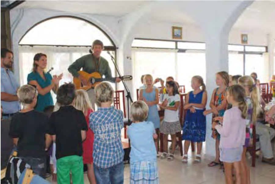
"Hvem har skapt alle fuglene?"