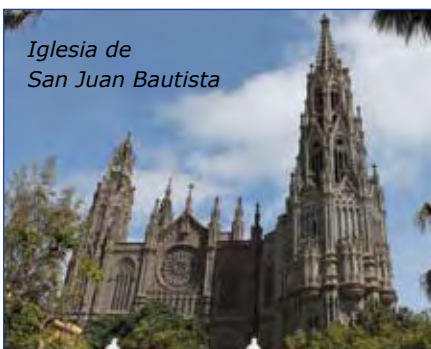
Iglesia de San Juan Bautista