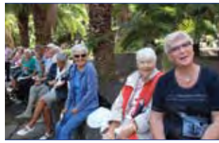
Tur for frivillige medarbeidere s. 17