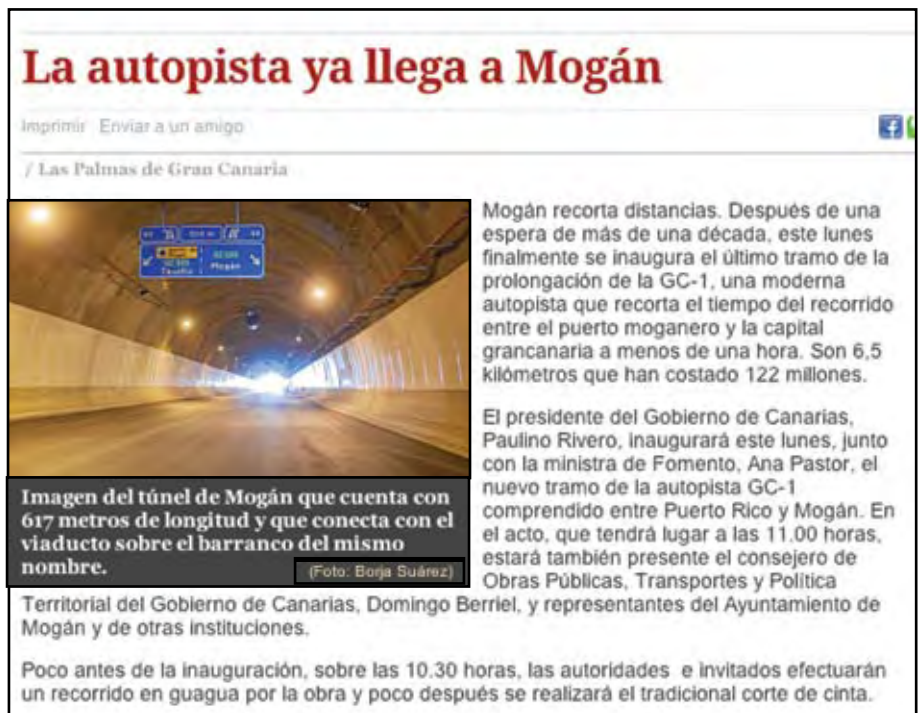
Faksimile av Canaria7 nettutgave 25/3 2013

I tillegg til øypresidenten deltok også flere andre representanter for regionale og lokale myndigheter,