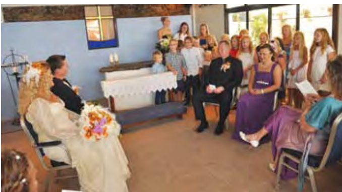
Sangen "Ingen er så nydelig som du" vakkert fremført av "Liv og Røre"

Familien forteller at de trives svært godt på denne fascinerende øya med verdens beste klima og de gir også uttrykk for at de setter pris på kirketilhørigheten: "Vi har et nært forhold til Sjømannskirken i Arguineguin og er glade for å få være en del av en fantastisk kirke i utlandet."