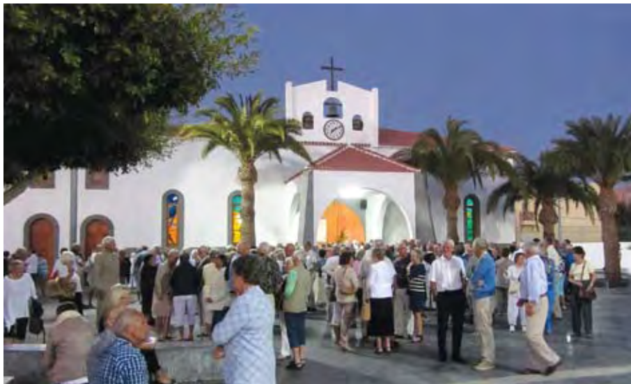
Stort fremmøte til norsk gudstjeneste i Den katolske kirken i vinterhalvåret

at også denne sida ved vår verksemd er etterspurd av mange. På søndagane i februar stod det lang kø ut på plassen ved den katolske kyrkja lenge før gudstenesta starta. I vinter starta vi opp med kveldsbøn på torsdagskveldar etterfølgd av felles kveldsmat. Mange sette pris på å ha eit slikt tilbod på ein kvardagskveld. No skriv vi mai månad og dei fleste vintergjestane våre er heime i Norge. Men kyrkja held ope heile sommaren. Kvardag og helg. Du er velkommen innom kvar søndag og dei fleste av kvardagane. Vi er ei tenande kyrkje, - ei kvardagskyrkje, heile året.