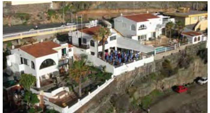
Fra 1990 til 2008 holdt kirken til i bolighuset midt på bildet ved siden av SunWing-hotellet