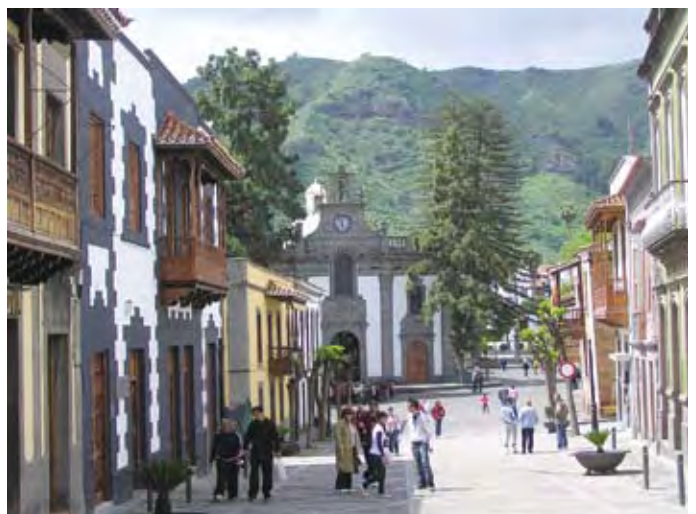
Teror er en vakker by nord på Gran Canaria

Denne festen som finner sted i byen Teror nord på Gran Canaria er en hyllest til Gran Canarias skytshelgen Virgen del Pino som ble kanonisert av pave Pío X i 1914. En legende forteller at Virgen del Pino viste seg i kronen av et furutre i 1491, tre år før spanjolene hadde erobret Kanariøyene. Til feiringen i Teror kommer det pilegrimsvandrere fra ulike steder på øya. Feiringen inneholder gudstjeneste, prosesjon og ulike konserter og kulturarrangementer.