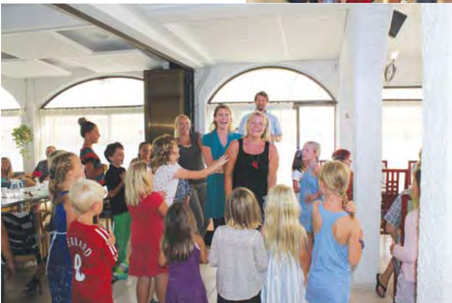
Henteleken: Finn enn person mellom 20 og 40 år.

Vi i staben syntes dette var et svært hyggelig og vellykket arrangement og takker for det gode oppmøtet og den gode opplevelsen!