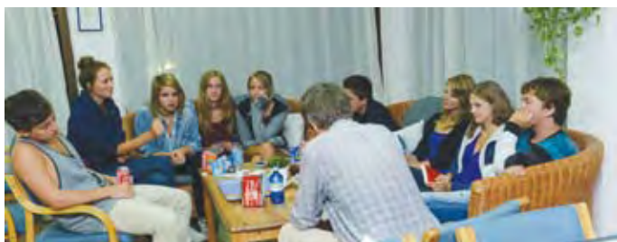
Mange gode samtaler har funnet sted i sofaen på biblioteket.

I tillegg til å bli kjent med en spennende storby, inneholder leiren samlinger og opplevelser midt inn i det konfirmasjonsundervisningen handler om. Musikalen Les Miserables hadde premiere i London i 1985. Den gripende historien av Victor Hugo handler ikke bare om Frankrike på 1800-tallet, men like mye taler den til oss alle om Guds kjærlighet og medmenneskelige relasjoner. Vi anbefaler musikalen som er satt opp i rundt 40 land verden over.