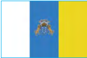
Det offisielle kanariske flagget

Mange av hellig- og høytidsdagene som feires i Spania og her på Kanariøyene kjenner vi igjen fra Norge. Men det finnes dager med lokal forankring eller dager som feires på andre måter enn vi er vant med fra Norge. Her nevner vi noe av det som skjer i vår.