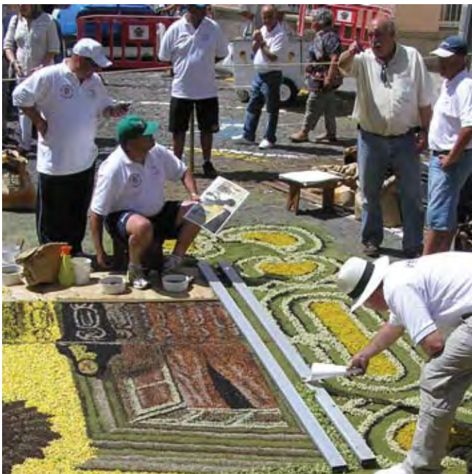
Dagen feires mange steder med å pynte gatene med blomster til de vakreste kunstverk. Dette bildet er fra Corpus Christi i La Orotava 2012

Dette er en vestlig og i første rekke katolsk festdag. Dagen feires normalt på torsdag etter treenighetssøndag. Dagen feires til minne om innstiftingen av nattverden. Av den grunn feires dagen på en torsdag, ettersom nattverden ble innstiftet skjærtorsdag. La Orotava på Tenerife har en sterk tradisjon på denne feiringen (se La Gaviota 0312). I år feires Corpus Christi i La Orotava 6. juni.