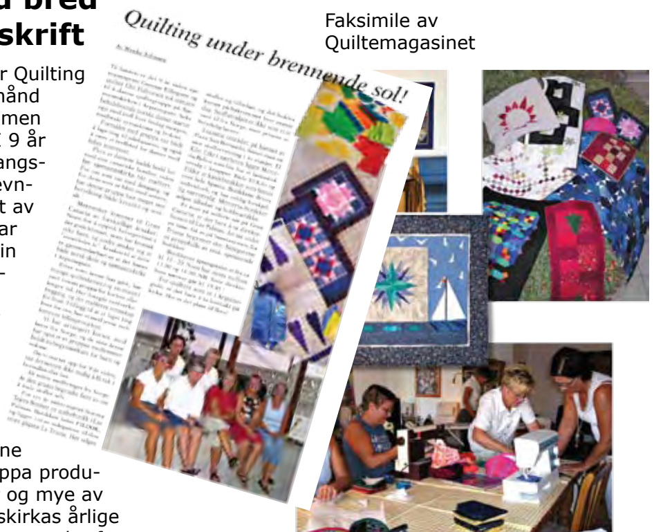
Faksimile av Quiltemagasinet