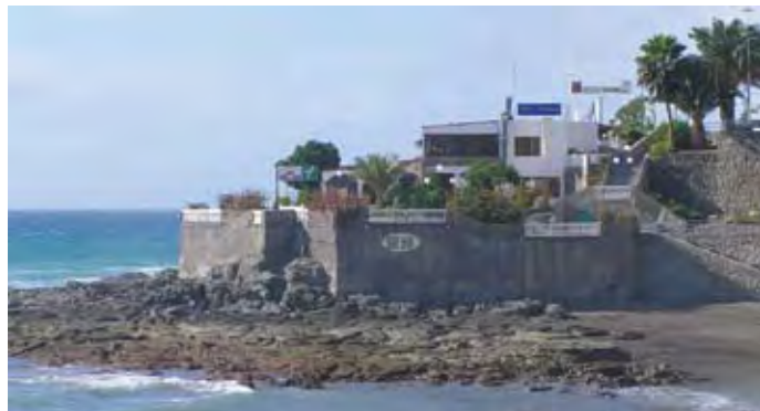
Det nye kirkesenteret

En gruppe nordmenn kom forleden innom kontoret. De ønsket å gi en gave til det nye bygget, og ba om forslag på noe de kunne stå for utgiftene for. Sjømannspresten svarte ganske kjapt: "Jo da, vi trenger utstyr til kjøkkenet. Dere kan jo gi en gryte til grøtlagingen." Forslaget ble meget gått mottatt. Men, dessverre kom spørsmålet om penger inn. Da fikk den glade givergjeng bakkoversveis. For til det nye kjøkkenet er det bestilt en gryte på 150 liter, programmerbar og selvførende til den nette pris av 160.000 kr! De ville