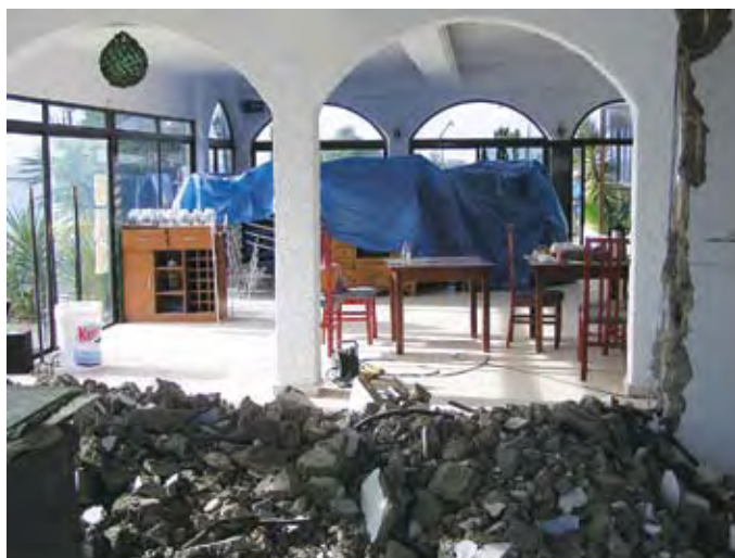
Stans i arbeidet

Det skulle mange byråkratiske krumspring til før den endelige overtagelsen kunne skje den 30. november. Arbeider ble satt i gang straks, og mye ble gjort frem til medio januar. Da fikk vi beskjed fra myndighetene om at ikke alle søknader om ombygging var i orden og at vi måtte avvente videre ombyggingarbeid.