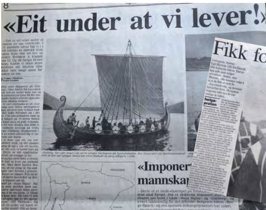
Faksimile av Sunnmørsposten fra maidagene 1992

tastiske og usannsynlige". Fantastisk og usannsynlig må vel også redningsaksjonen sies å ha vært. I orkan og grov sjø med opp til 15 meter høye bølger havarerte både Saga Siglar og Oseberg. Spanske medier omtalte redningsaksjonen som et under. Kapteinen på spanske Off Valencia drog ut for å søke uten de nødvendige tillatelser. Da besetningen på Saga Siglar var funnet og reddet, overtalte de Off Valencia til å fortsette søket en time til fram til mørket gjorde det umulig. Etter 11 timer i sjøen uten overlevingsdrakter - de var stjålet i Valencia - kun med seilerdrakter og redningsvester, ble Myrene og resten av mannskapet fra Oseberg plukket opp. Da hadde de klamret seg til en delvis istykkerrevet gummibåt og så Off Valencia passere mange ganger. Ikke før Off Valencia var nærmere enn 100m oppdaget de mannskapene i sjøen. "Eg er realist, men har sansen for det fantastiske og usannsynlige". Restene av Saga Siglar ble sanket sammen og fungerte som blikkfang på verdensutstillingen, mens vrakgods fra Oseberg ble funnet blant annet i Marokko.