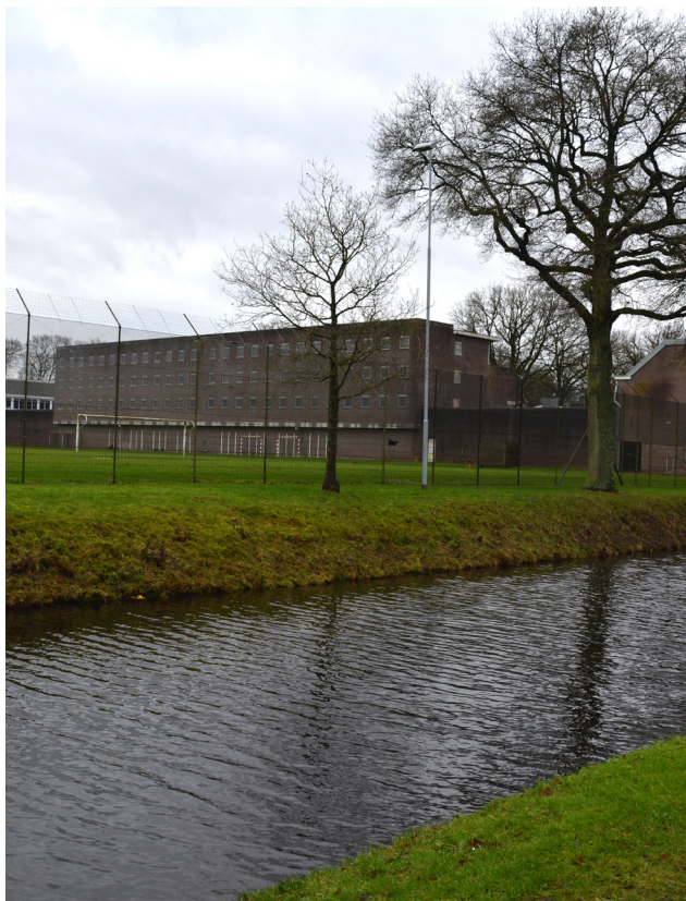
Norgerhaven fengsel i Nederland.

Kriminalomsorgsdirektoratet (KDI) har bevilget 145 500 kroner til sjømannskirkens besøkstjeneste overfor innsatte i fengslet. Sjømannskirken har overfor KDI skissert muligheten for en fast besøksordning, samt ulike kirkelige- og sosiale tiltak og samtalegrupper.