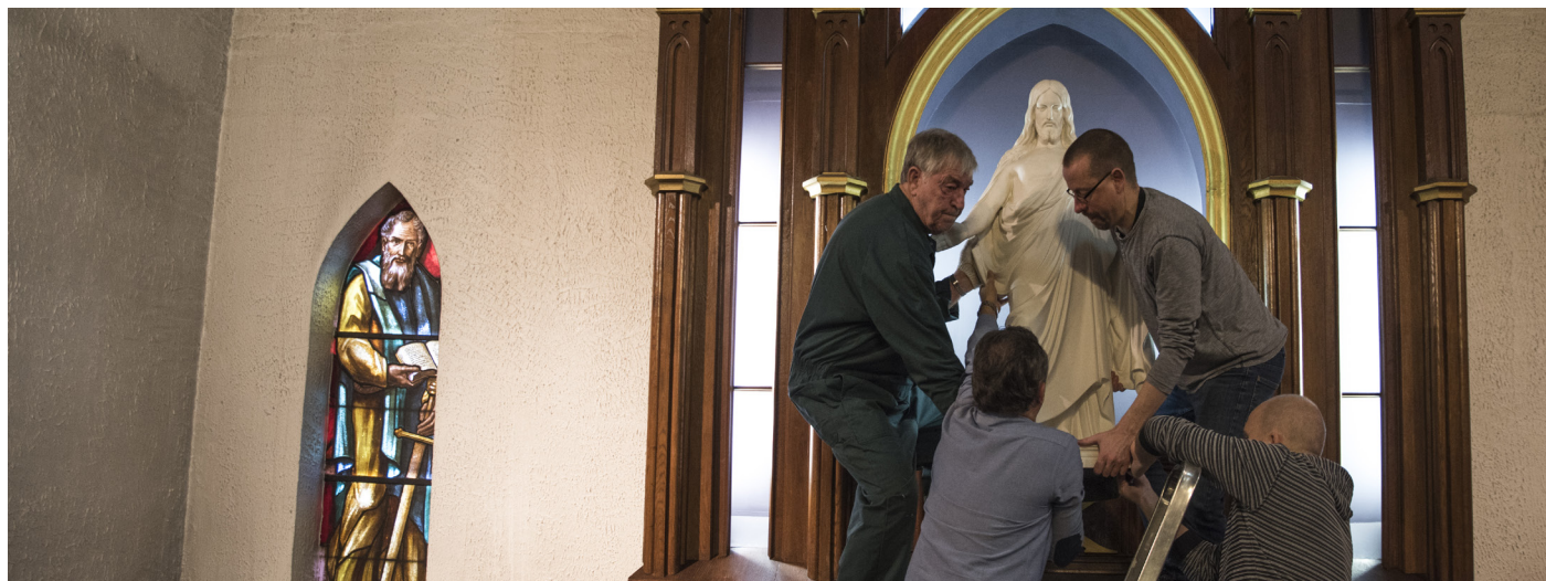
Kristus-statuen bæres ut av den gamle Sjømannskirken i Antwerpen.