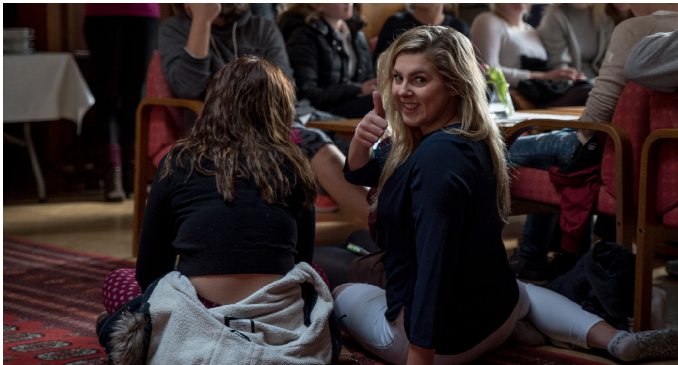
Konfirmanter på leir i Sjømannskirken i London.