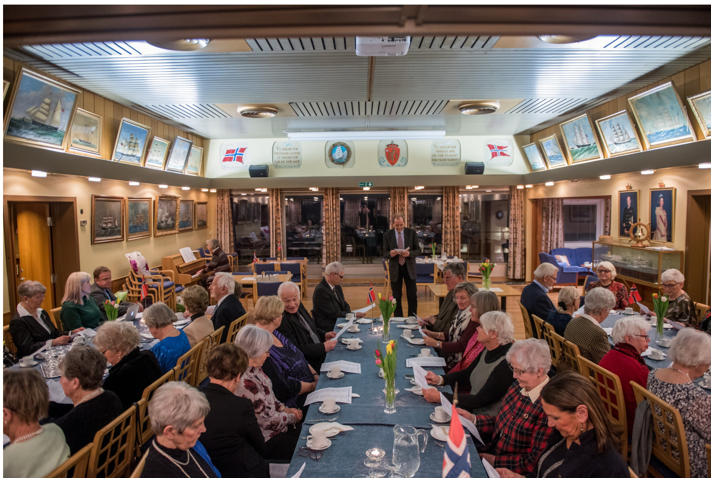
Fra jubileumsfesten for Kristiansand eldre Sjømannskirkeforening (150 år)