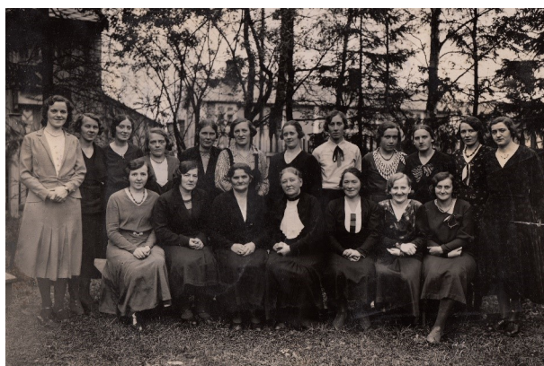
Rognan forening, Saltdalen, 1935

Regionstyret bør se på mulighetene for å danne nye grupper. Kanskje er det flere tidligere uteansatte i et område som kunne få en utfordring? Kanskje er det flere medlemmer som bor i nærheten av hverandre som kunne ha gleden av å møtes som ei gruppe? I slike tilfelle kan regionstyret fungere som en initiativtaker.