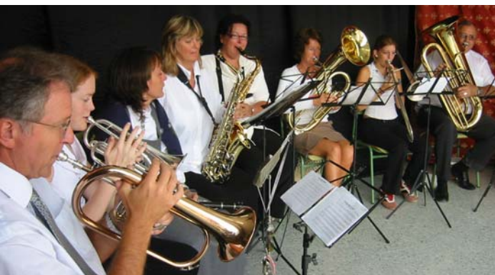
Skolekorpset underholdt fra scenen.