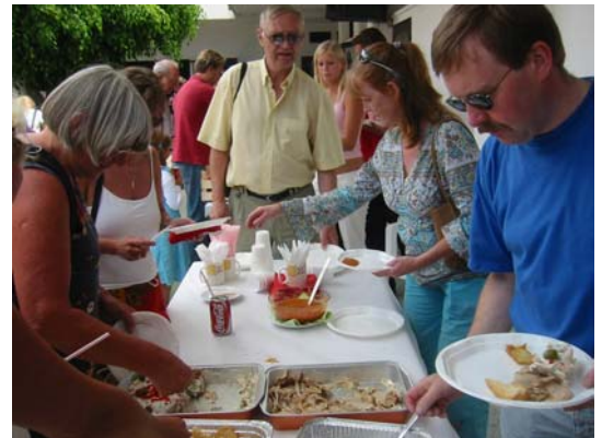
Alle fikk forsyne seg av kanarisk tapas