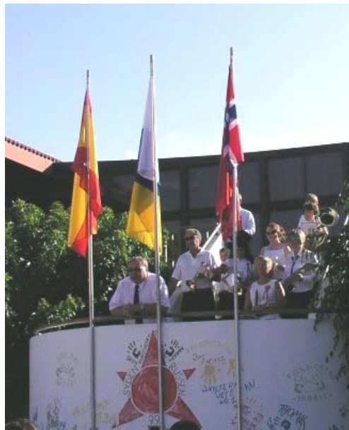
Flaggheising og velkommen til frokost