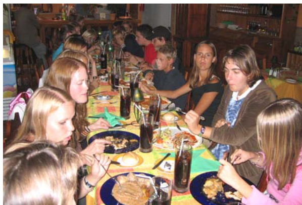
Begge kveldene var vi ute og spiste sammen.