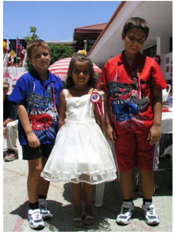
Søsken i rødt , hvitt og blått