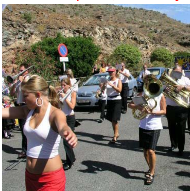
Skolekorpset hadde en travel dag