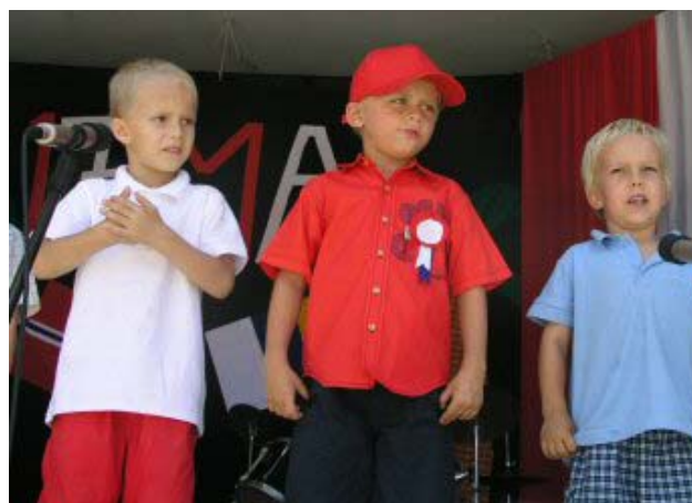
Vi ere en nasjon vi med, vi små en alen lange