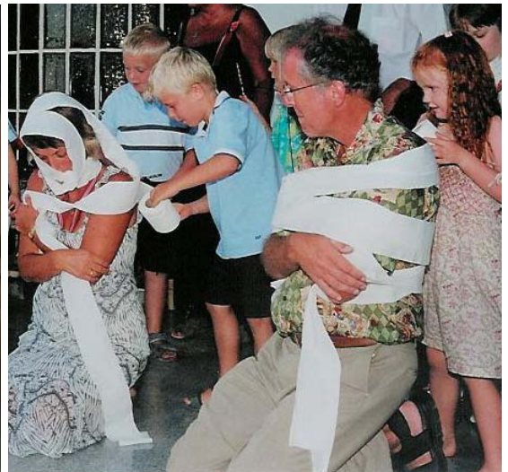
Om kvelden var det fest for store og små på Sjømannskirken