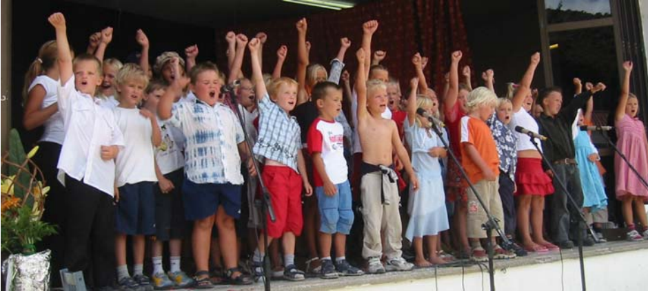
De minste skolebarna jubler for skolen sin.