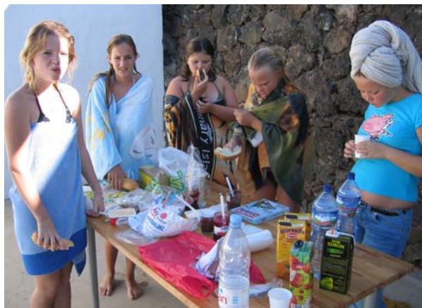
Frokosten måtte vi ordne med selv, og den ble inntatt mens vi sto i kø til den eneste dusjen!