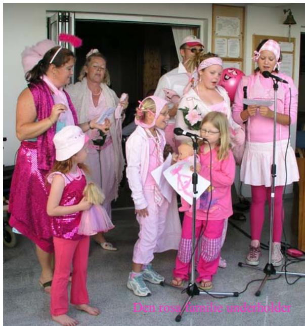
Den rosa familie underholder