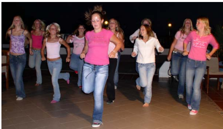
Vi opptrådte med både dans, sang og musikk.