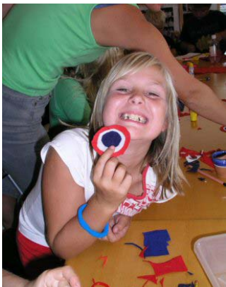
Barneklubben Liv og Røre