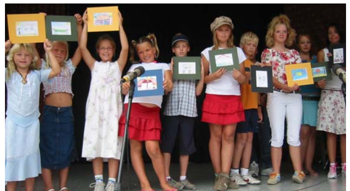
Her er vinnerne av tegnekonkurransen