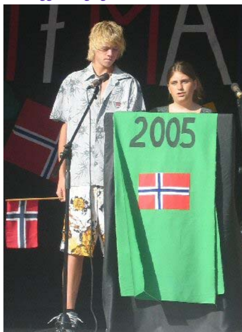
Ord for dagen ved skolefrokosten