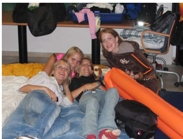
Vi bodde meget trangt, men dermed ble vi også bedre kjent med hverandre...