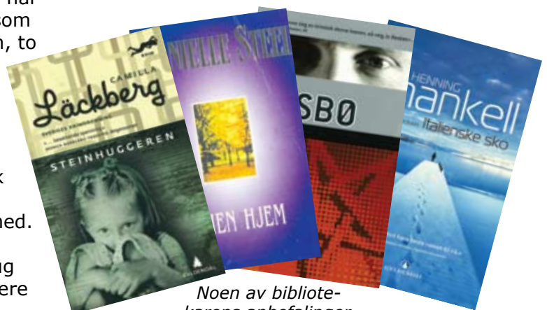
Noen av bibliotekarens anbefalinger