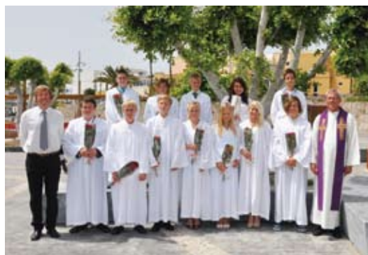
Konfirmasjon og Londontur s. 9