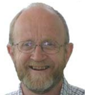
Tidligere GC-prest åpner ny kirke s. 14