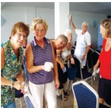
Vårdugnad s. 6