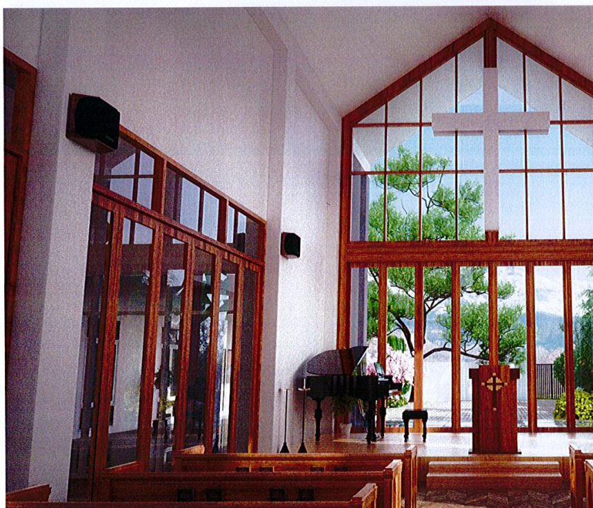
Arkitekttegninger: Slik vil den ferdig Sjømannskirken i Pattaya se ut.